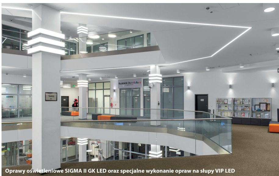
Oprawy oświetleniowe SIGMA II GK LED oraz specjalne wykonanie opraw na słupy VIP LED

PXF Lighting to polska firma produkcyjna. 25 lat działalności w branży oświetleniowej przekłada się na duże doświadczenie i znajomość światowych trendów. PXF Lighting jest członkiem Polskiego Związku Przemysłu Oświetleniowego oraz europejskiej organizacji Lighting Europe. Firma posiada 10 przedstawicielstw na terenie Polski. Dział Eksportu prowadzi sprzedaż do ponad 60 krajów świata.