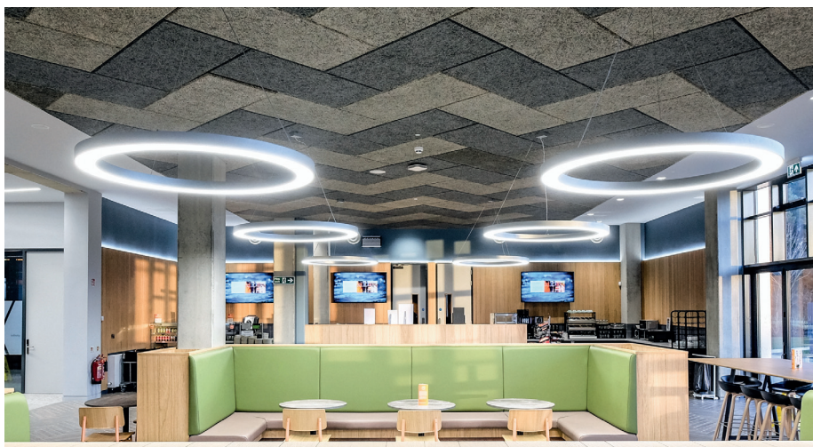
Oprawy wewnętrzne GEOMETRIC LED